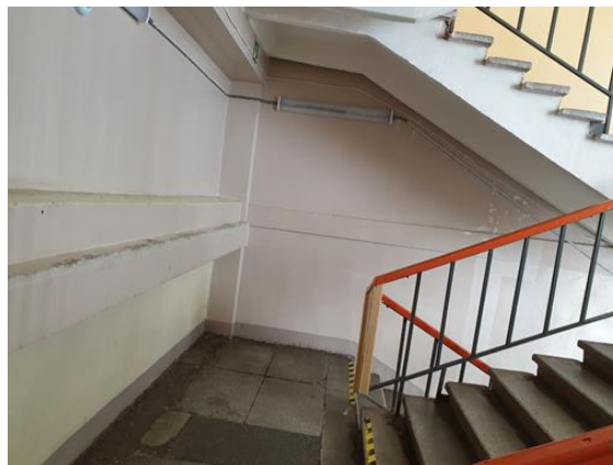
2. Renoveerimist vajav trepikoda