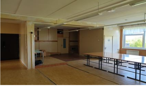
3. Renoveerimist vajav puhkenurk õpilastele