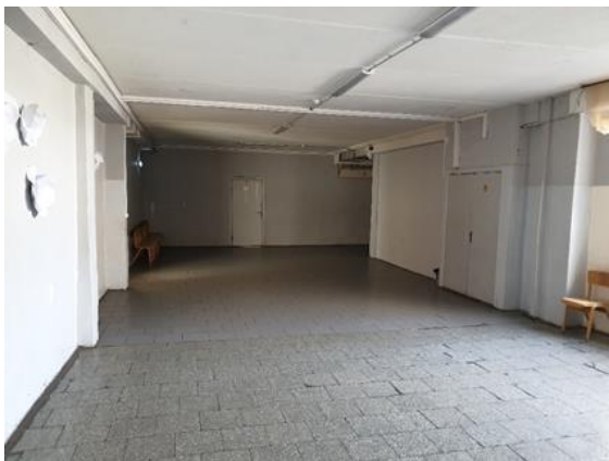
1. Renoveerimist vajav koridor