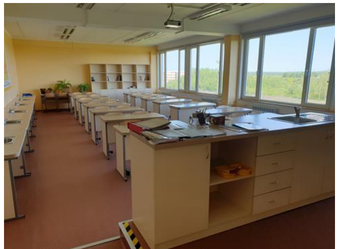
9. Renoveeritud klassiruum (keemiaklass)