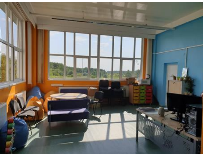
8. Huvijuhi ja õpilasesinduse ruum