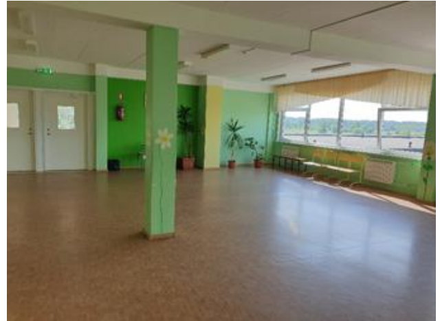
2. Renoveeritud koridor