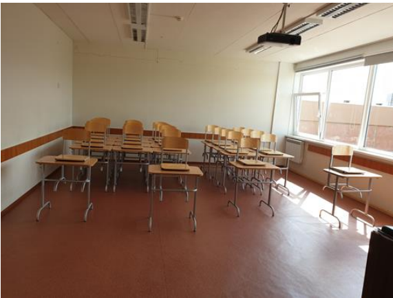
5. Renoveerimist vajav klassiruum