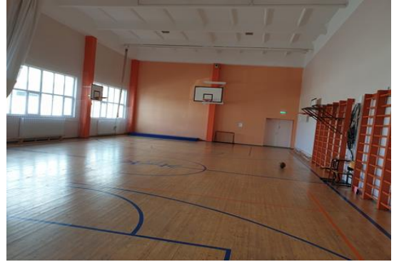
4. Renoveerimist vajav spordisaal (põrand)