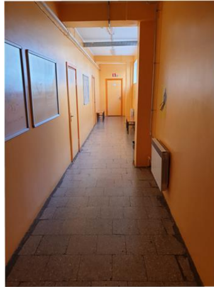
7. Renoveeritud koridor